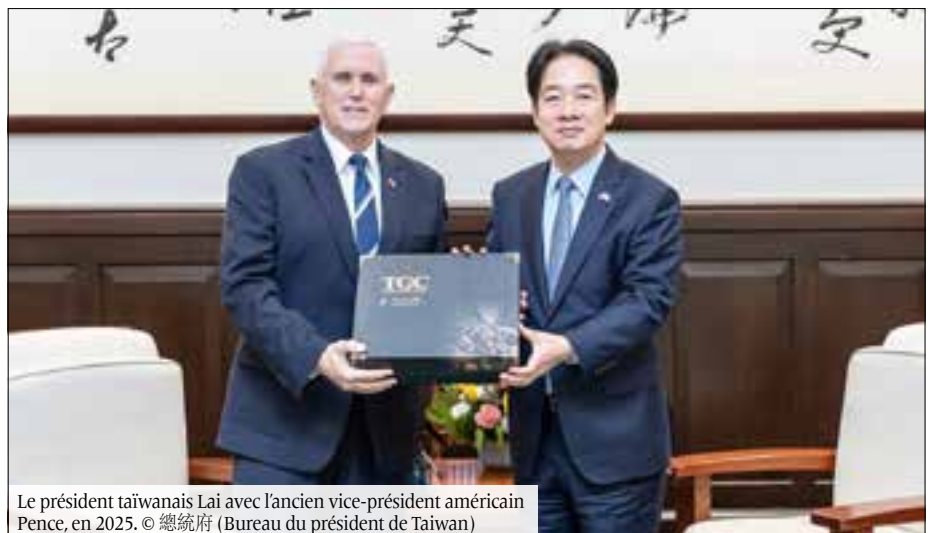
Le président taïwanais Lai avec l'ancien vice-président américain Pence, en 2025.

Il convient toutefois d'examiner le statut de « Taïwan » ou « ROC » du point de vue du peuple taïwanais, et non de celui des gouvernements chinois, américain ou d'autres. Ce point de vue doit également