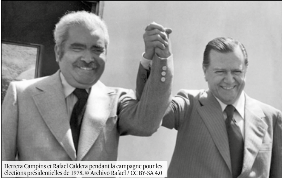
Herrera Campins et Rafael Caldera pendant la campagne pour les élections présidentielles de 1978.

Luis Herrera Campins (1979-1984), des signes d'effondrement du modèle sont apparus, avec la contraction du PIB réel par habitant au cours de certains trimestres ou années, la chute du taux d'accumulation du capital, une inflation qui passe de niveaux modérés (7 % en 1978) à des niveaux plus élevés, affectant de manière accélérée la qualité de vie de la population, l'augmentation de la dette extérieure, les déficits budgétaires et commerciaux naissants. L'intellectuel vénézuélien Arturo Uslar Pietri disait que le Venezuela avait dilapidé pendant cette période l'équivalent de vingt plans Marshall.