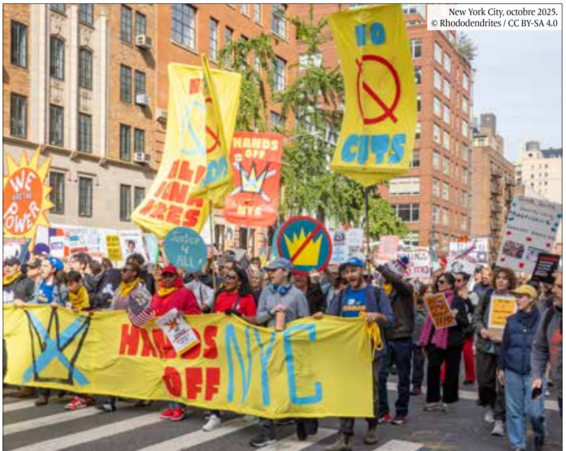
New York City, octobre 2025.