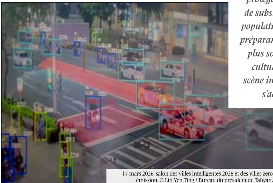
17 mars 2026, salon des villes intelligentes 2026 et des villes zéro émission.

la défense militaire, et pas seulement cette dernière. Plus Taïwan renforce sa démocratie et protège les moyens de subsistance de sa population tout en se préparant à la guerre, plus son influence culturelle sur la scène internationale s'accroît. En Chine, de nombreux sympathisant-es potentiels de Taïwan existent dans la société civile, ainsi