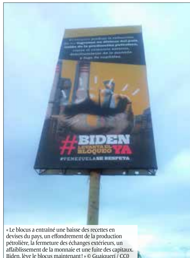
« Le blocus a entraîné une baisse des recettes en devises du pays, un effondrement de la production pétrolière, la fermeture des échanges extérieurs, un affaiblissement de la monnaie et une fuite des capitaux. Biden, lève le blocus maintenant! » © Guaiquerí / CCO