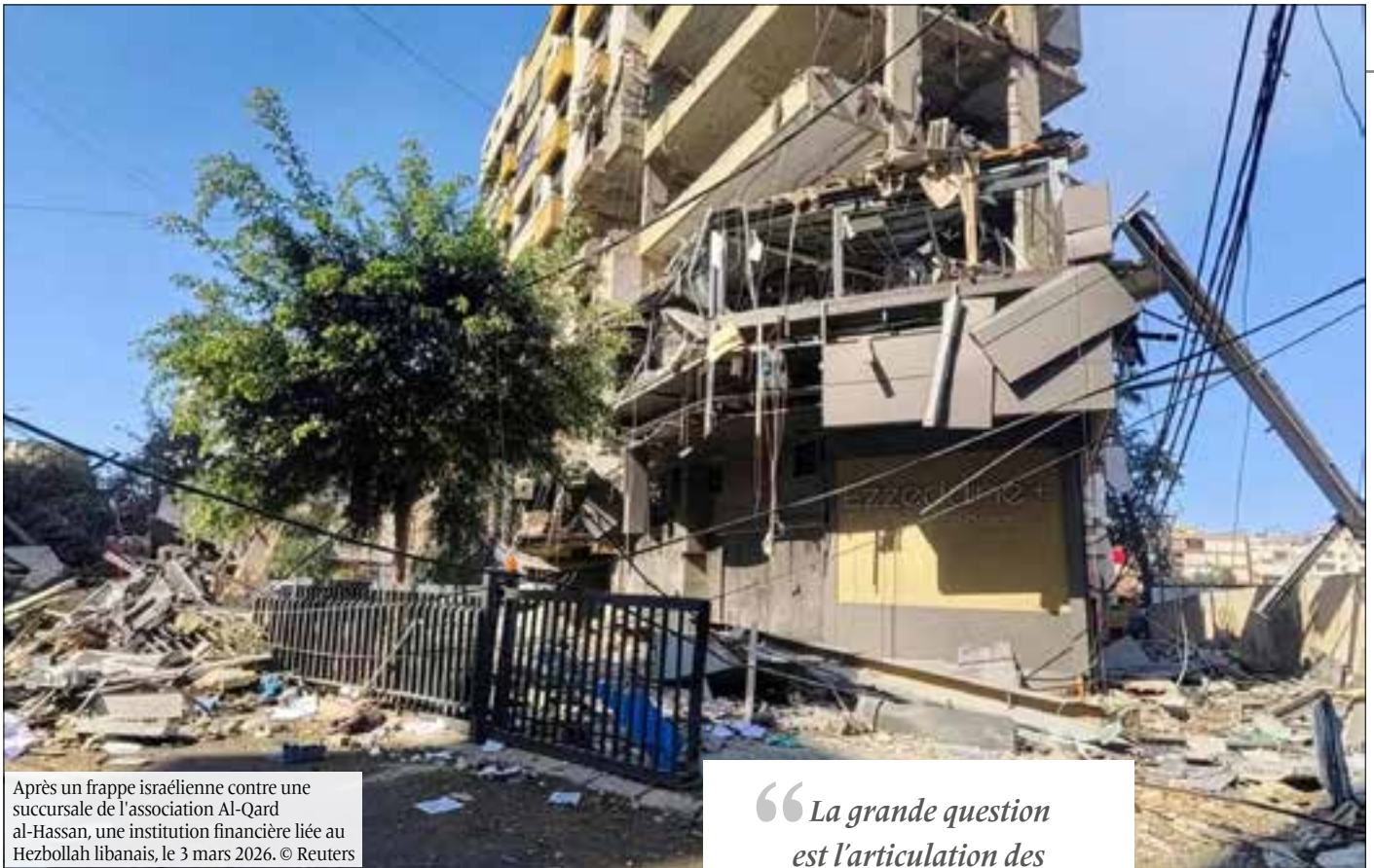
Après un frappe israélienne contre une succursale de l'association Al-Qard al-Hassan, une institution financière liée au Hezbollah libanais, le 3 mars 2026.

“La grande question est l'articulation des mouvements anti-guerre avec les mouvements anti-coloniaux dans le sud global.”