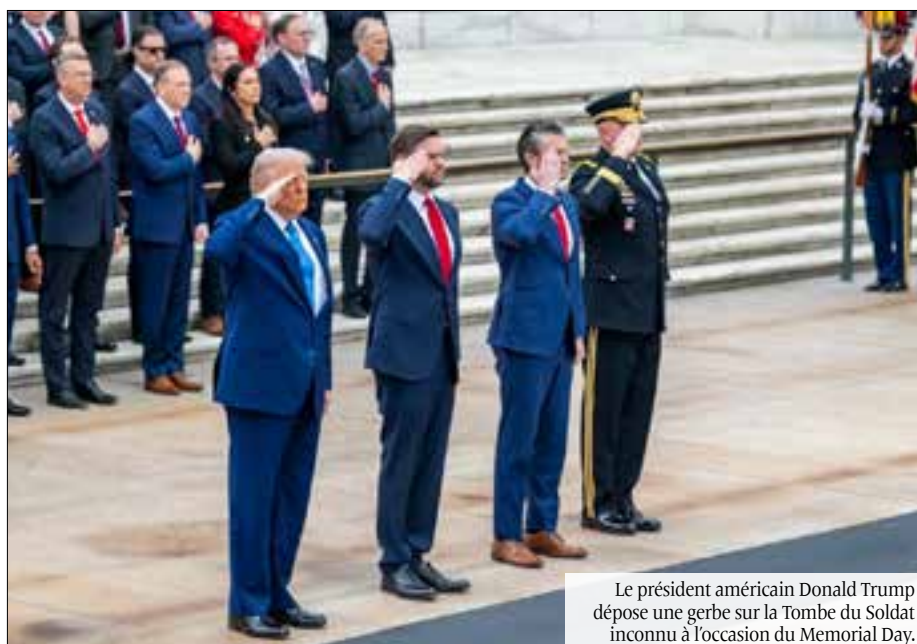
Le président américain Donald Trump dépose une gerbe sur la Tombe du Soldat inconnu à l'occasion du Memorial Day.