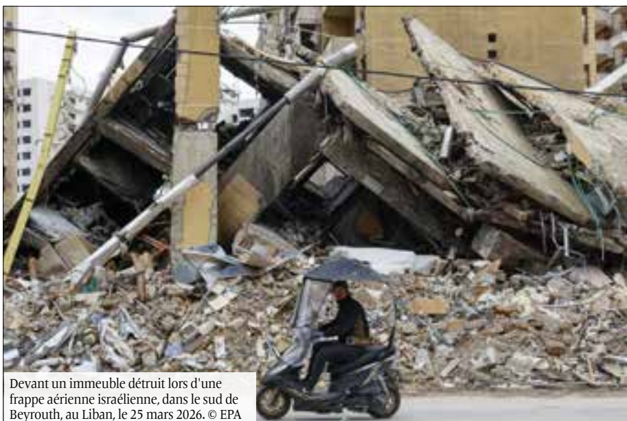
Devant un immeuble détruit lors d'une frappe aérienne israélienne, dans le sud de Beyrouth, au Liban, le 25 mars 2026.