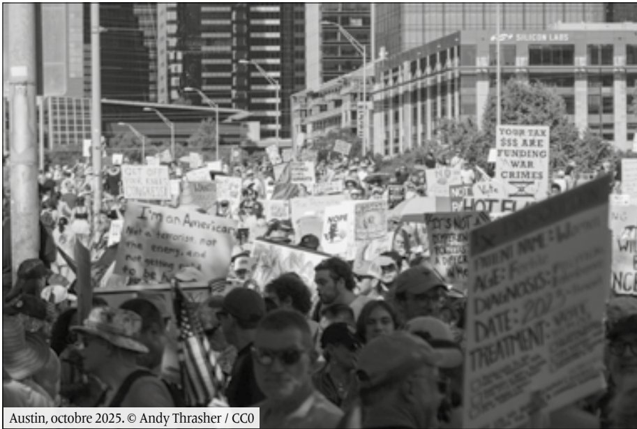
Austin, octobre 2025.

l'instant pas vu déferler en nombre les agent-es de l'ICE mais où un mouvement anti-ICE se développe en préparation d'une telle éventualité.