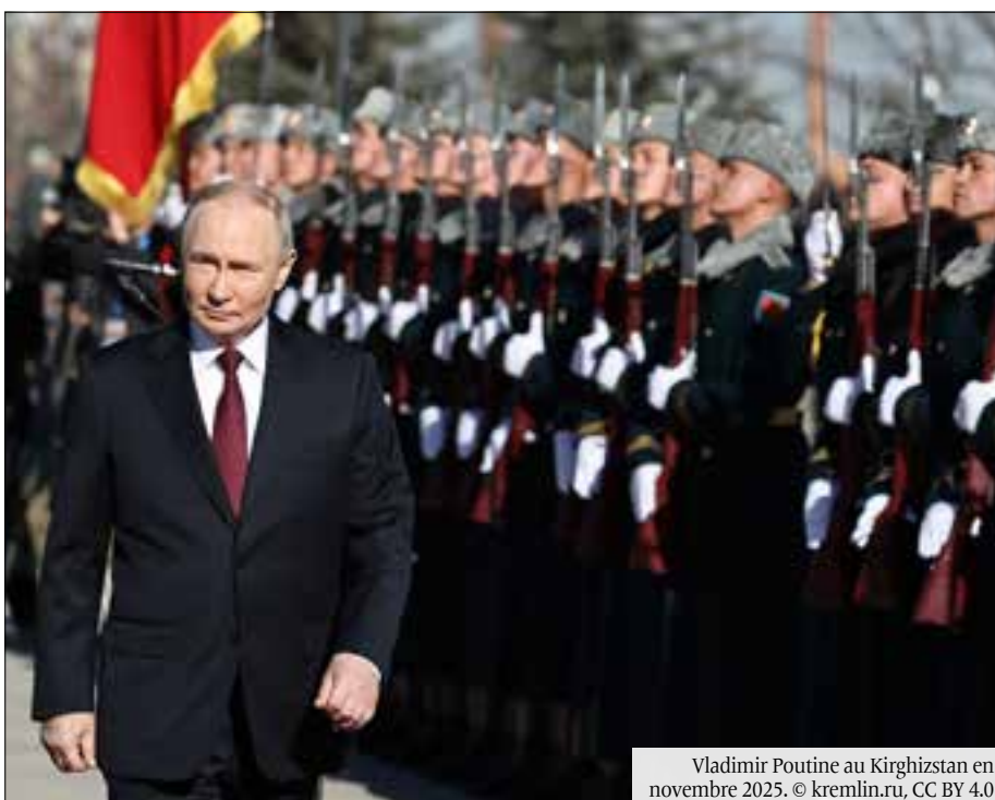
Vladimir Poutine au Kirghizstan en novembre 2025.

“ Derrière le discours officiel appelant à une fin rapide des hostilités, Washington n'a pas nécessairement intérêt à une paix immédiate. ”